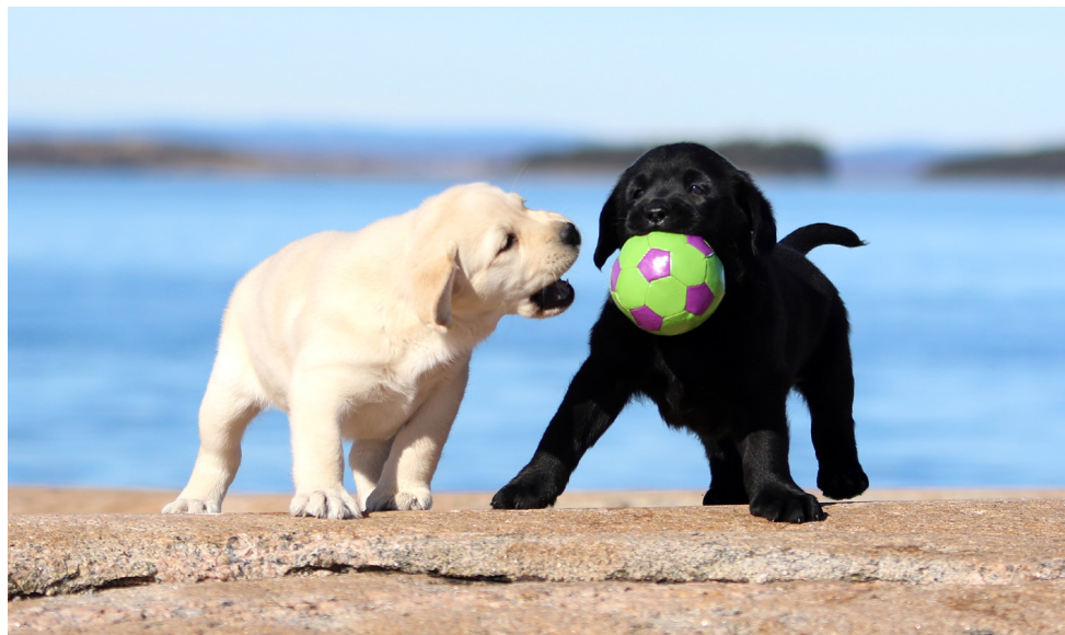
LABRADOR RETRIEVER.

omtales som rasepopulasjonen også bør inkludere populasjonen i de mest aktuelle samarbeidsland, for eksempel Norden.