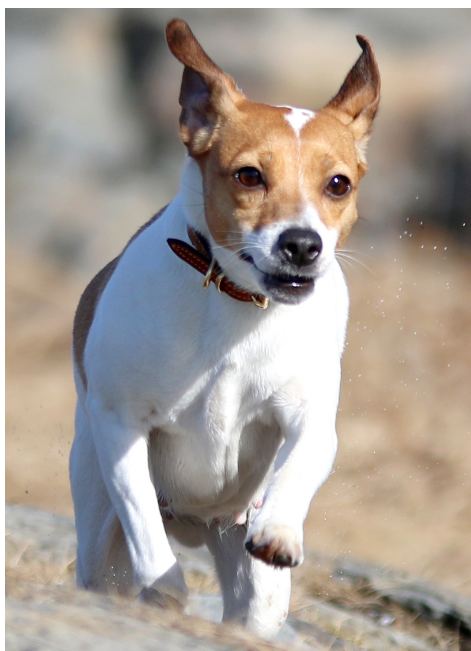
DANSK-SVENSK GÅRDSHUND.

4.1. Bare funksjonelt, klinisk friske hunder skal brukes i avl. Hvis nære slektninger av en hund med en kjent eller antatt arvelig sykdom brukes i avl, bør den pares med en hund som kommer fra en familie med lav eller ingen forekomst av tilsvarende sykdom.