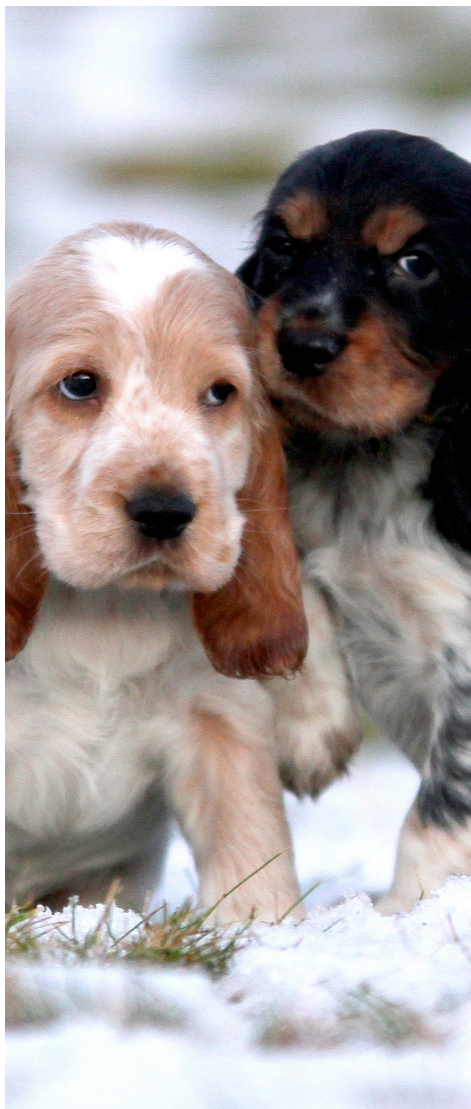
COCKER SPANIEL.

*Vedtatt av Norsk Kennel Klubs Hovedstyre 22.05.2008, revidert 08.12.2009. Tillegget i pkt 2 samt forandring i pkt 7, første strekpunkt, gjelder fra 01.07.2010. Oppdatert etter HS-vedtak 21.06.2012 (tillegg nest siste setning pkt 3). Siste del av pkt 5, 2. avsnitt samt endringer i pkt 7, strekpunkt 3-8 er vedtatt av HS 25.05.2016 og gjeldende fra samme dato. Tillegg i pkt 3, siste setning, er vedtatt av HS 14.12.2016. Reaksjonsmåter for brudd på grunnreglene er vedtatt av HS 11.11.2011.